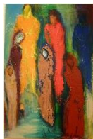
Maria, ich nenne dich Schwester

Ein Frauenteam gestaltet kreativ regelmäßig am letzten Freitag des Monats einen Wortgottesdienst. Hier weisen wir noch einmal auf den Gottesdienst am letzten Freitag im Mai hin. Dieser wird am 31.05.2024, um 18.00 Uhr in der Luciuskirche gefeiert. Das Thema lautet: „Maria, ich nenne dich Schwester“. Maria hat Unsicherheiten, widrige Lebensbedingungen, Trauer und Schmerz aushalten müssen und ist doch nicht am Leben verzweifelt. Sie hat sich mit anderen Frauen solidariert und ist ihnen so nah wie eine Freundin oder Schwester gewesen. Im Anschluss sind alle zum gemütlichen Beisammensein mit einem kleinen Imbiss in die Begegnungsstätte des Luciusdorfes eingeladen.